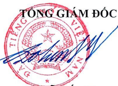
Đỗ Tiên Sỹ