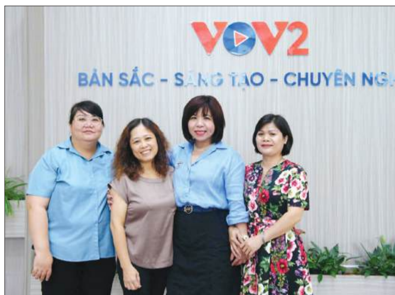
Nhóm tác giả của “Rạng rỡ Việt Nam”.

Để thực hiện được một chương trình đầy ý nghĩa như vậy, nhóm tác giả đã phải tìm cách thể hiện những tư tưởng sâu sắc về “sức mạnh nội sinh”, “phẩm cách Việt Nam” sao cho dễ tiếp cận với công chúng, đặc biệt là qua sóng