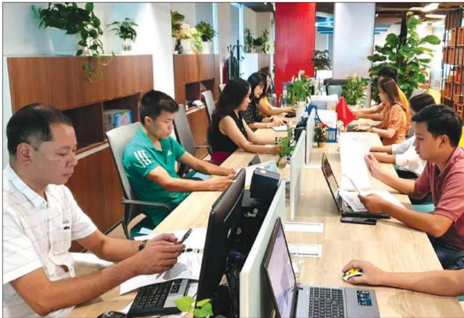
Kinh tế báo chí đang là vấn đề nan giải của hầu hết tòa soạn báo tại Việt Nam.

Ngày 14/6/2025, trong khuôn khổ Kỳ họp thứ 9, Quốc hội khóa XV đã biểu quyết thông qua Luật Thuế thu nhập doanh nghiệp (TNDN - sửa đổi) với 94,56% đại biểu tán thành. Dự thảo Luật đã bổ sung quy định miễn thuế TNDN đối với phần thu nhập từ hoạt động báo chí in và báo chí điện tử có giấy phép, phù hợp với chủ trương tại Kết luận số 19-KL/TW của Bộ Chính trị về quy hoạch báo chí toàn quốc.