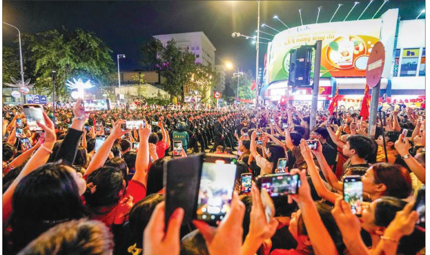
Các đoàn diễu binh đi giữa vòng tay nhân dân.

Cũng lần đầu tác nghiệp tại sự kiện diễu binh, diễu hành kỷ niệm Ngày Giải phóng miền Nam, phóng viên Nguyễn Quang (Báo Phụ nữ TP.HCM) ban đầu nghĩ đơn giản đây chỉ là một đợt tác nghiệp lớn như bao lần trong 10 năm làm báo của anh. Tuy nhiên, khi thật sự hòa mình cùng đồng nghiệp tác nghiệp từ các buổi tập