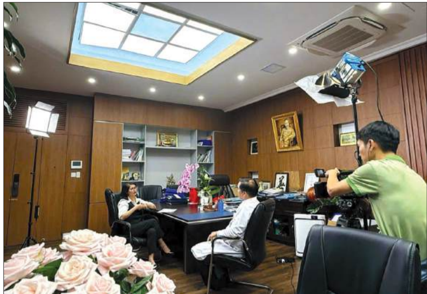
Ê-kíp tác giả thực hiện tác phẩm “Không buông tay”.

những vấn đề thời sự “nóng” nhất trong năm 2024. Con bão và trận lũ với sức tàn phá khủng khiếp đã gây ra thiệt hại nặng nề về người và cơ sở vật chất. Không khí tang thương bao trùm ở nhiều nơi, trong đó có làng Nũ.