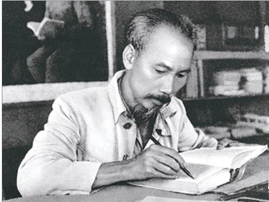
Chủ tịch Hồ Chí Minh đã sáng lập báo Thanh Niên - tờ báo cách mạng đầu tiên của Việt Nam.

Ngày 1/4/1922, sau rất nhiều nỗ lực và gian truân, nhà cách mạng Nguyễn Ái Quốc đã thành công khi cho ra đời Le Paria (Người cùng khổ). Ngoài việc là chủ bút tờ báo, phụ trách biên tập, xuất bản báo, Nguyễn Ái Quốc còn là cây bút chủ lực. Le Paria đã tạo nên dấu ấn báo chí đặc biệt trên đất Pháp thời bấy giờ, như trong bản báo cáo của mật thám Pháp thừa nhận: “Báo Le Paria (Người cùng khổ) có trách nhiệm tố cáo những hành động lạm dụng chính trị, đoán về hành chính, sự bóc lột về kinh tế mà các nạn nhân là dân chúng trong những vùng rộng rãi ở hải ngoại (tức là thuộc địa). Báo cũng