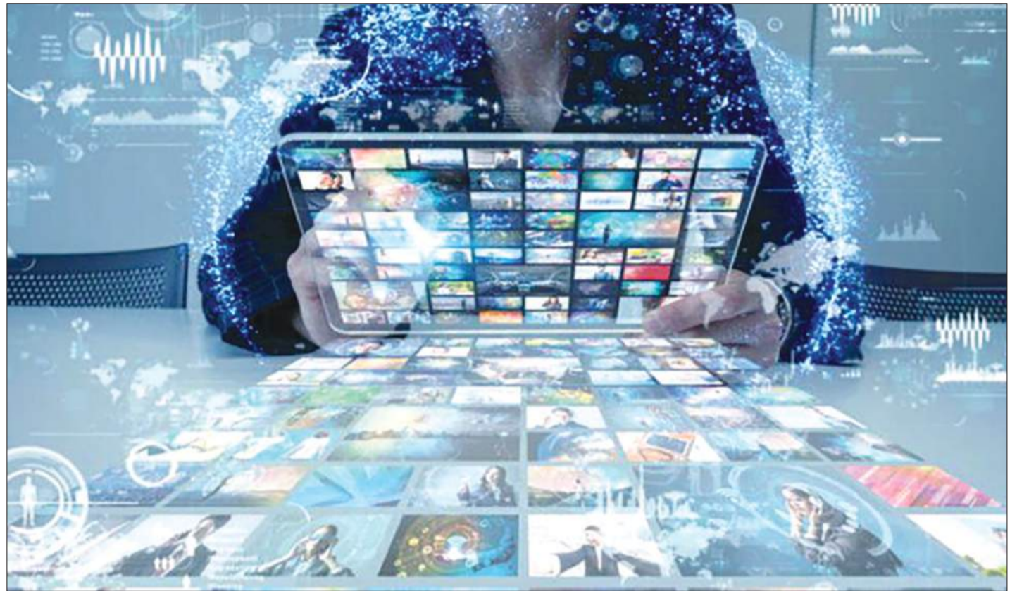
Để thông tin, xác thực, dẫn dắt và kiến tạo niềm tin xã hội, báo chí - truyền thông bắt buộc phải chuyển đổi số toàn diện.

Trong bối cảnh đó, báo chí - truyền thông truyền thống nếu chỉ dừng lại ở báo in, phát thanh, truyền hình hoặc báo điện tử đơn thuần sẽ khó giữ chân công chúng. Thách thức lớn hơn là khả năng duy trì vai trò trung tâm trong không gian truyền thông, vốn ngày càng bị phân mảnh bởi sự cạnh