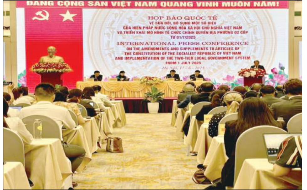
Hội báo quốc tế công bố chính thức Quyết định vận hành tổ chức bộ máy mới của Việt Nam theo mô hình chính quyền 2 cấp từ 1/7/2025.

Trong bối cảnh đất nước đang thực hiện những cuộc cách mạng về thể chế, tinh gọn bộ máy, đẩy mạnh đổi mới sáng tạo và chuyển đổi số quốc gia, báo chí đã diễn giải, phân tích, làm cho các chủ trương này trở nên gần gũi, dễ hiểu, thấm sâu vào nhận thức và hành động của mọi tầng lớp nhân dân. “Thời gian qua, báo chí đã tích cực tuyên truyền, phản ánh sâu sắc về tinh thần “kỷ nguyên mới”, “kỷ nguyên vươn mình”, qua đó khơi dậy niềm tự hào, ý chí tự lực, tự cường và khát vọng phát triển đất nước. Báo chí đã phát huy vai trò tiên phong trong việc tuyên truyền, triển khai Nghị quyết số 18-NQ/TW về sắp xếp, tinh gọn bộ máy với hàm nghĩa đây là một “cuộc cách mạng” của dân tộc. Song hành với việc thông tin rõ chủ trương, chính sách, báo chí thể hiện vai trò định hướng dư luận thông qua việc giải đáp băn khoăn, phân tích sâu sắc, đa chiều, tạo sự đồng thuận cho toàn hệ