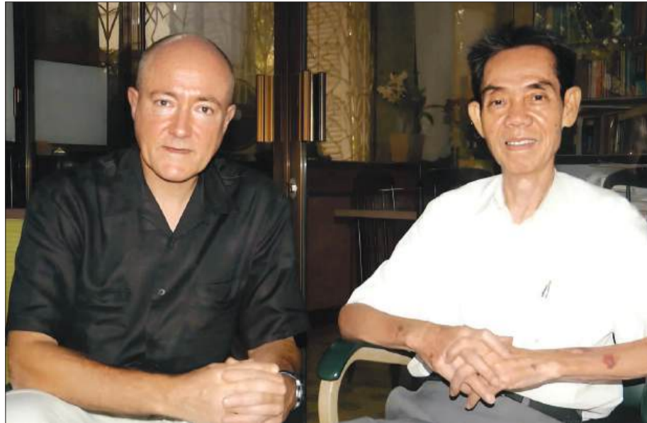
Giáo sư Larry Berman và ông Phạm Xuân Ẩn.