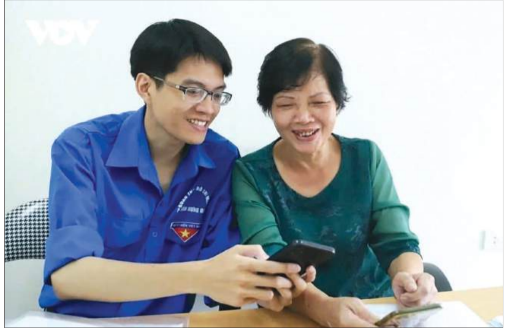
Đợt lấy ý kiến nhân dân về sửa đổi Hiến pháp năm 2013 đã khép lại với tỷ lệ tán thành dự thảo Nghị quyết sửa đổi đạt 99,75%

Thực hiện Kế hoạch số 05 của Ủy ban dự thảo sửa đổi, bổ sung một số điều