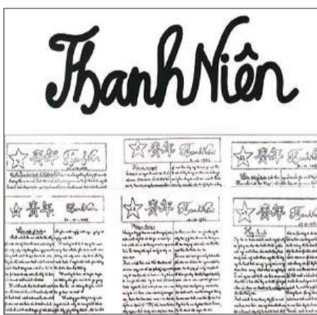
“Thanh Niên” - tờ báo cách mạng đầu tiên của Việt Nam.

kêu gọi họ tập hợp lại để phấn đấu cho những tiến bộ về vật chất và tinh thần của chính bản thân họ và mời họ vào tổ chức với mục đích giải phóng những người bị áp bức khỏi những thế lực thống trị để thực hiện tình thương yêu và hữu ái. Và mục đích cuối cùng của tờ báo là “Giải phóng loài người!”.