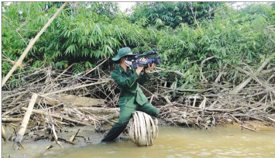
Trong cuộc chiến phòng chống tham nhũng, lãng phí, sự rủi ro với các nhà báo đôi khi còn gấp nhiều lần so với các lực lượng chuyên trách.

lãng phí ở Tây Nguyên, Đồng bằng sông Cửu Long, Đồng bằng sông Hồng... Tất cả đều có sự góp sức của báo chí.