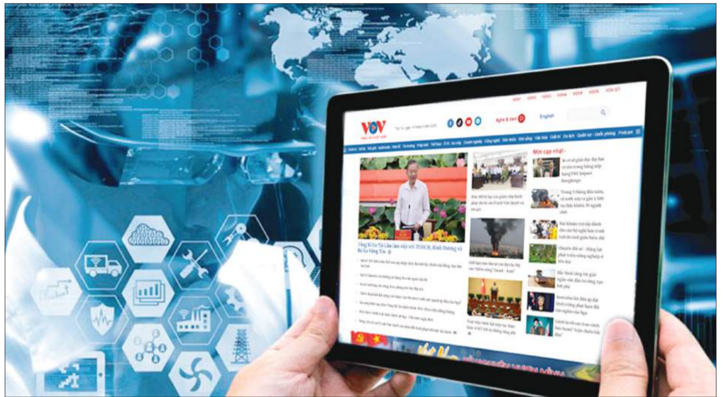
Đài Tiếng nói Việt Nam không ngừng đổi mới sáng tạo, giữ vững vai trò tiên phong trong lĩnh vực truyền thông quốc gia.

Chúng ta nhớ lại, khi sáng lập báo Thanh Niên, khởi nguồn của báo chí Cách mạng Việt Nam, Chủ tịch Hồ Chí Minh kính yêu và cũng là nhà báo vĩ đại hiệu quả báo chí là công cụ hữu hiệu và sắc bén để tuyên truyền cách mạng, vận động quần chúng. Và sự thực trong một thế kỷ qua, báo chí Cách mạng Việt Nam tự hào vì đã làm rất tốt trọng trách này. Ngày nay, khi chúng ta tiến bước vào kỷ nguyên giàu mạnh, thịnh vượng, phát triển, báo chí nước nhà cần tiếp tục thực hiện tốt nhất sứ mệnh, đặc biệt và trước hết là truyền thông chính sách. Các cơ quan báo chí, trong đó có Đài Tiếng nói Việt Nam (TNVN) là kênh thông tin, là phương thức cơ bản để truyền thông về khát vọng phát triển đất nước, thực hiện các mục tiêu 100 năm; về các Nghị quyết của Đảng; về các quyết sách, pháp luật của Quốc hội; về sự chỉ đạo, điều hành của Chính phủ và về sự tham gia của toàn xã hội hướng tới tương lai. Trong thời điểm này và sắp tới, nhiệm vụ truyền thông chính sách đặt ra hết sức nặng nề với yêu cầu rất cao khi chúng ta nhìn nhận chính sách luôn luôn là vấn đề quan trọng hàng đầu trong sự phát triển kinh tế - xã hội, giữ