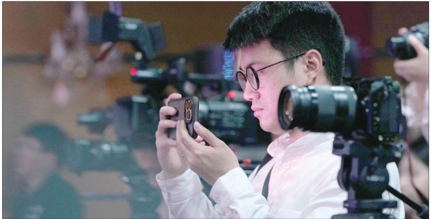
Báo chí không thể đứng ngoài cuộc chuyển đổi số, mà phải đi đầu nếu muốn giữ vai trò dẫn dắt.

Trước hết, báo chí cách mạng phải giữ vững uy tín của mình. Nếu mình